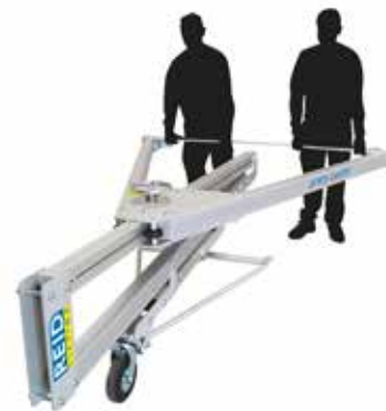
MANUTENTION EN MODE BROUETTE