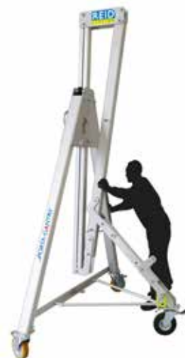
MANUTENTION EN MODE VERTICAL